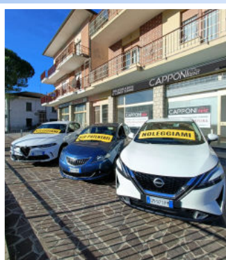
Sede operativa Via Circonvallazione Loc. Sassocorvaro, 19 61028 Mercatale

Novità 2023: apertura nuove sedi a Cattolica, Fano, Mercatale e presto a Rimini.