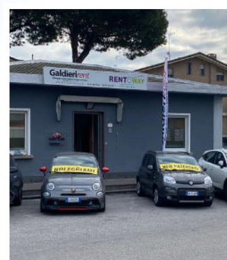
Sede operativa Via Emilia Romagna 269, 47841 Cattolica