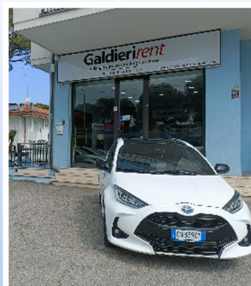
Sede di Viale Circonvallazione, 93 a Riccione

Car Solution è point per la provincia di Rimini di Galdieri Rent, realtà nazionale parte del gruppo Galdieri (Galdieri Auto, Galdieri Petroli, Sistem Rental, Galdieri Services e Galdieri Energy) che vanta oltre 70 anni di successi e di soddisfazione del cliente.